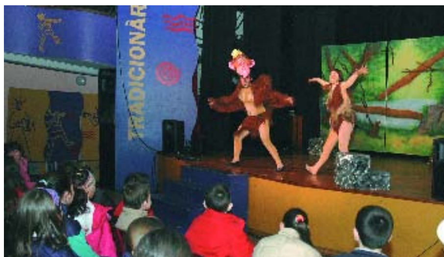
La guia inclou dades de festivals, entre d'altres.

La nova publicació s'ha fet en format CD i també es podrà consultar a partir de finals de març al web del Districte. Inclou més de 400 entrades amb dades d'equipaments socioculturals, entitats, festivals, béns d'interès cultural... Serà consultable a partir de final de març i es complementarà amb diverses publicacions similars com la guia de recursos musicals, que estarà a començament d'abril disponible al mateix web, juntament amb una altra que recull les llibreries del Districte. Aquestes publicacions –i d'altres com la d'esports i la guia d'entitats que treballen per a persones amb disminucions i malalties cròniques– pretenen dinamitzar aquests sectors.