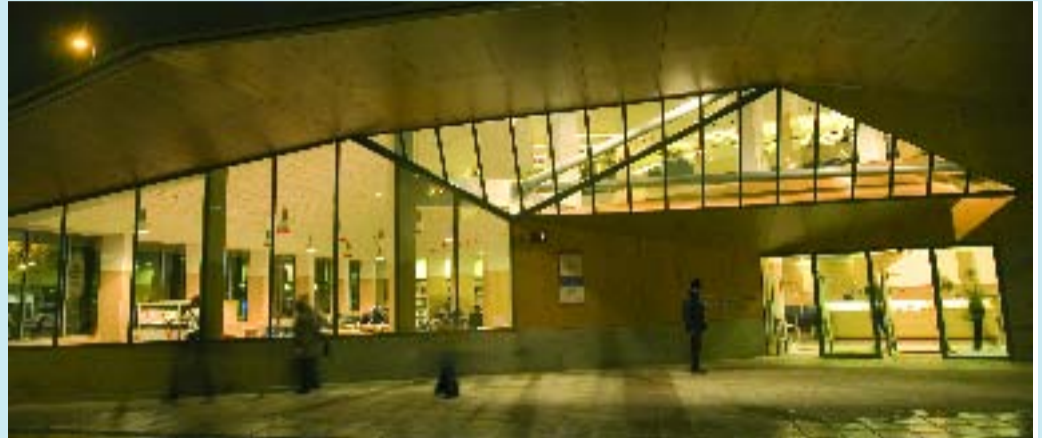
El 2006 va ser l'any de consolidació de la Biblioteca Jaume Fuster.