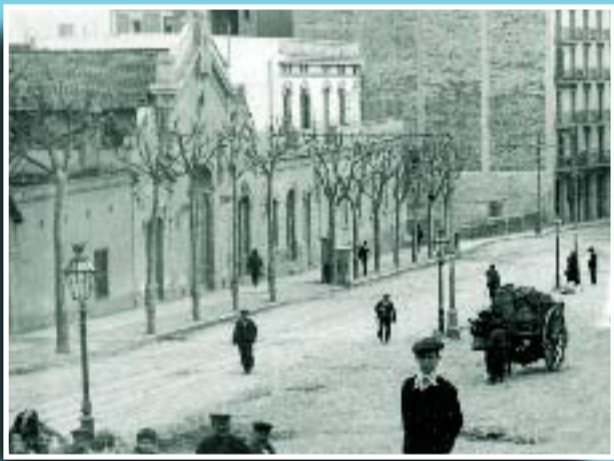
Edifici de la primera cotxera de tramvies tirats per cavall a la plaça dels Josepets (Lesseps).

Si té fotografies o documents del seu barri, en pot fer donació a l'Arxiu Municipal del Districte, 93 368 45 66