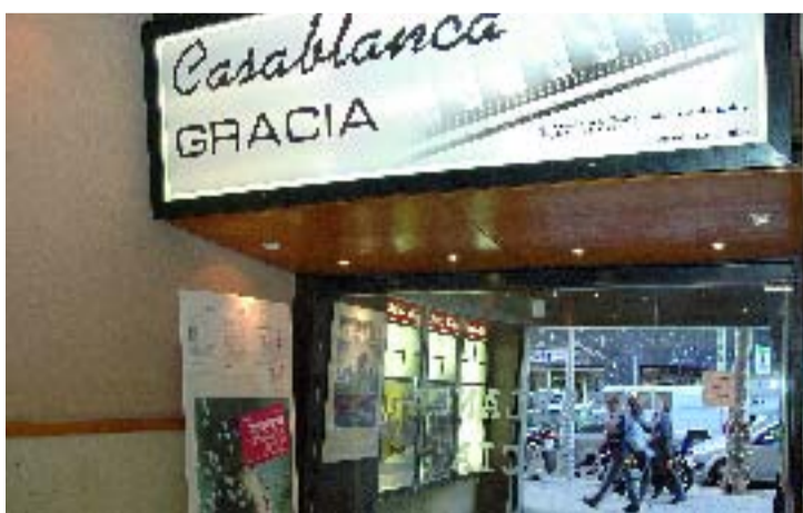
La sala 3 del Casablanca Gràcia acull a partir d'ara Cineambigú.