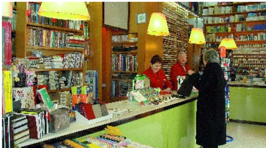
Al mes d'abril es publicarà una guia de llibreries.

A més d'aquests tres productes, el Districte reedita durant aquest mes de març la Guia d'esports de Gràcia i la Guia d'entitats que treballen per a persones amb disminució i malalties cròniques . Aquests treballs, que van veure la llum fa quatre anys i ara tornen a publicar-se amb la informació actualitzada, pretenen dinamitzar aquests sectors, tot divulgar la informació sobre les seves activitats.