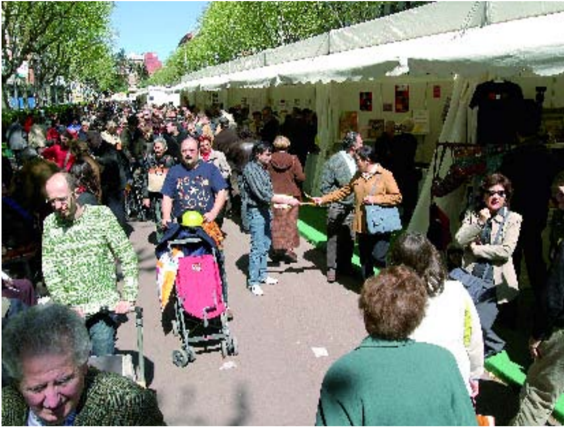
Una imatge de la mostra de l'any 2005.

La Mostra d'Entitats de Gràcia, que se celebra els dies 9, 10 i 11 de març, es farà al tram del passeig de Sant Joan comprès entre els carrers de Còrsega i la travessera de Gràcia