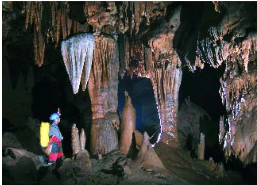
A l'Espeleo Club realitzen produccions pròpies des de 1979.

teló, s'havia convertit en l'únic referent mundial per a les produccions espeleològiques. Durant 14 edicions, el festival va promocionar el cinema espeleològic mundial, amb una especial atenció a les produccions de l'Estat espanyol i de Catalunya.